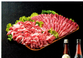
寄付金額42億円で全国1位(2015年度)の宮崎県都城市の返礼品は豚肉や焼酎など。返礼品を用意している自治体は9割超に上り、地元の農産物やコメが多い

取県鳥取市では鳥取砂丘でパラグライダー半日体験など。地元への誘客を図るうと、自治体も工夫している。 総務省によれば、2015年度のふるさと納税の寄付額は1652億円。制度が始まった08年度の81億円から急増した。家計簿アプリ「マネーフォワード」の調査でも、ふるさと納税を利用したことがある人は4割を超えている(下図)。