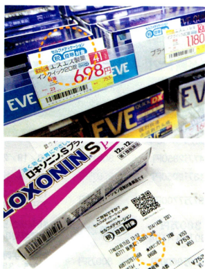
ビックドラッグでは、対象品の値札に青色マーク(上)、 レシートに★印がつく(下)

従来の医療費控除は、医療機関へ の支払いや医薬品購入費などが計10 万円を超えてから。この特例は1万 2000円超から控除できるので、 対象者は増えそうだ。病院にあまり 行かず、市販薬で 済ませている人 に、恩恵が大きい とみられる。