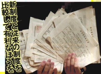
新制度と従来の制度を 比較して有利なほうを選 ぶ

る父が難病になり、入院や治療 で15万円ほどかかりました。2人 分を合算し、15万円の医療費控 除をするつもりです」