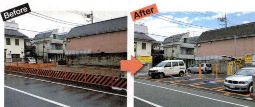
タイムズの利用例。設備は1カ月くらいで整えられる