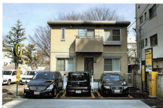
三井のリパークでは玄関先の駐車場化にも対応