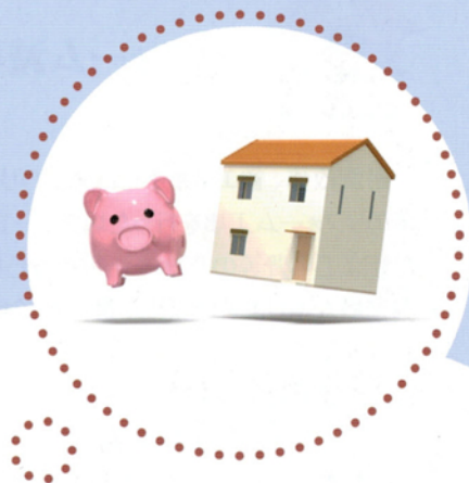
図表2●住宅ローン減税と消費税率アップの関係のイメージ

(※1)長期優良住宅、低炭素住宅の場合は控除対象借入限度額3,000万円、最大控除額300万円 (※2)長期優良住宅、低炭素住宅の場合は控除対象借入限度額5,000万円、最大控除額500万円